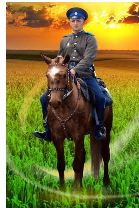
пос. совхоза «Селезнёвский» 2014